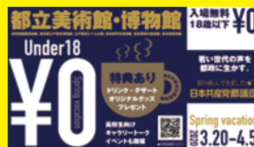
都議団作成のバナー(2020年1月)

「もっと気軽に芸術にふれたい」という若者の声をうけ、質問するとともに、若者の美術館料金値下げ条例を提案しました。都は、若者が芸術文化にふれることは大切と答え、18歳以下の料金を無料にする春休み企画を計画するなど、一歩を踏み出しました(コロナ感染防止のため中止)。