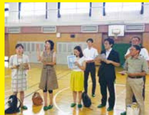
エアコンのある体育館を視察(2018年8月)