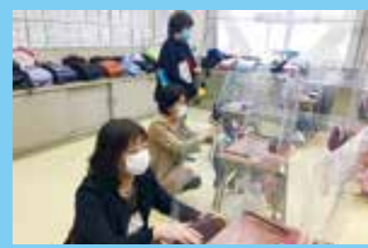
都内の小学校を視察(2021年1月)

手厚い教育のためにも感染拡大防止のためにも少人数学級が必要だとの世論が大きく広がり、ついに国は、小学校全学年を5年間で35人学級にする方針を決めました。「もっと早くやってほしい」「ゆとりができる」「先生の確保が大切」「35人の次は30人に」と期待が寄せられています。都として前倒しで実施するよう求めています。